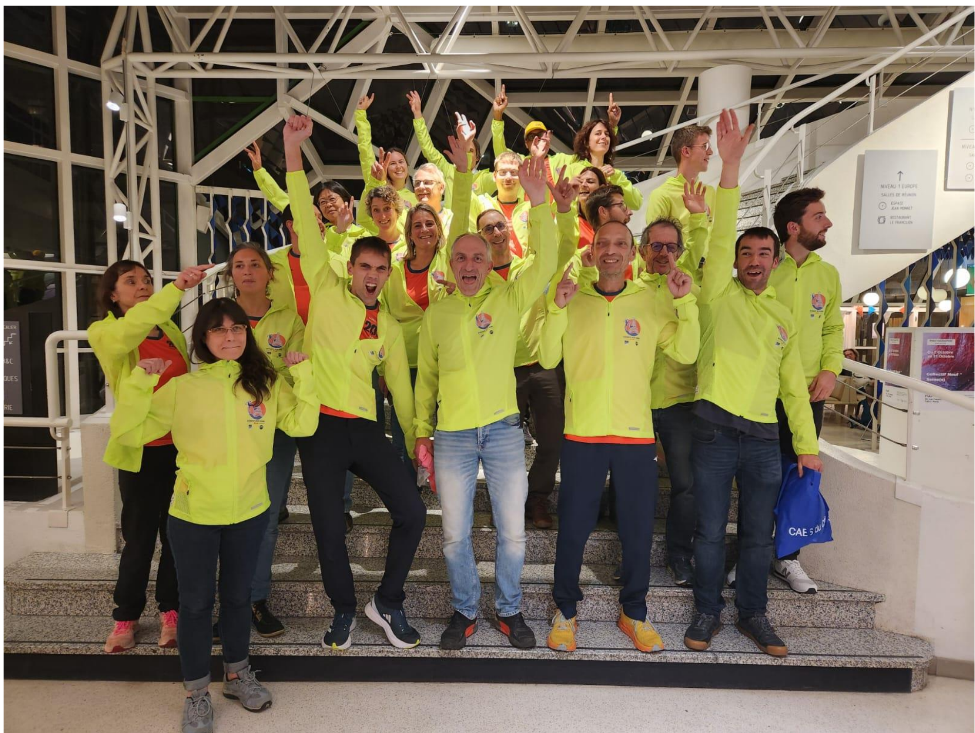
Equipe RDS 2024